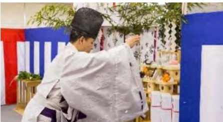
(安全祈願祭の様子)

工事期間中はご近隣の皆様にご不便をお掛けしますが、ご理解とご協力を賜りたくお願い申し上げます。